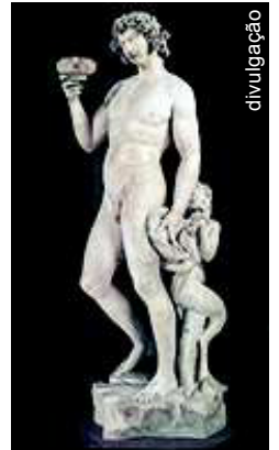
Baco, Michelangelo, Museu Nacional do Bargello, Florença.